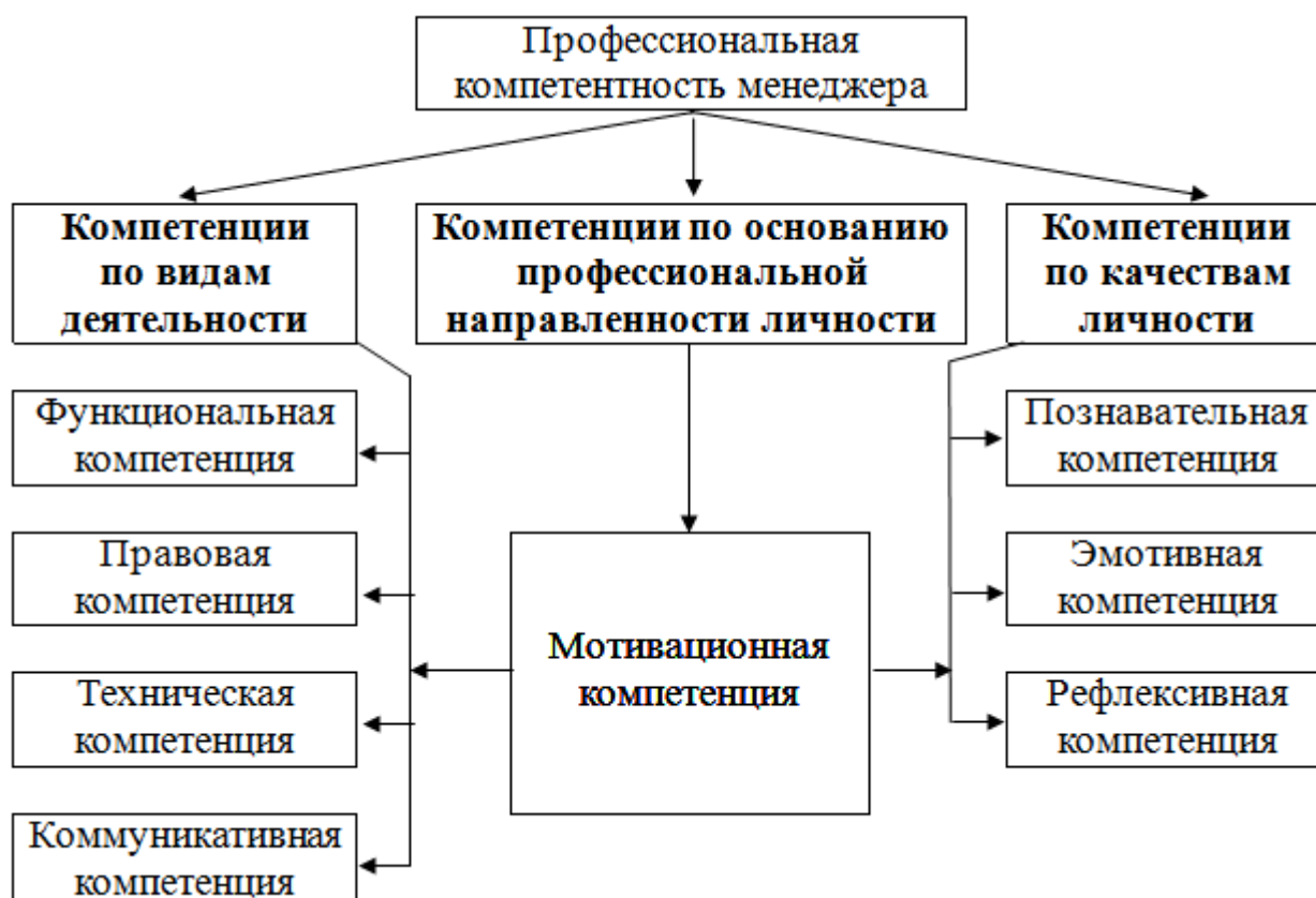
Рис. 2. Структура профессиональной компетентности менеджера.

Сформированные профессиональные компетенции, освоенные менеджером, могут и должны быть аттестованы в процессе их реализации.